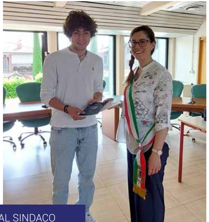
LA PAROLA AL SINDACO