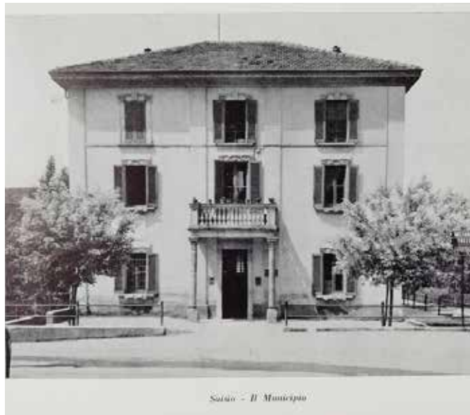
Suisio - Il Municipio

funzionali attraverso un miglioramento sismico ed energetico dello stabile, nonché una ridistribuzione interna degli ambienti. Sarà nostra cura fornire adeguata comunicazione sullo stato di avanzamento dei lavori, come di consueto attraverso i canali ufficiali del Comune di Suisio.